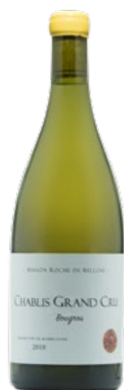
CHABLIS GRAND CRU · BOUGROS 2018

372,31 €/botella de 0,75l en caja de 6 botellas