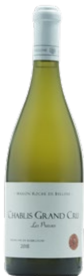
CHABLIS GRAND CRU · LES PREUSES 2018