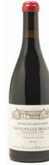
SAVIGNY-LES-BEAUNE 1ER CRU-HOMMAGE À JEAN FERTÉ 2018

65,15 €/botella de 0,75l en caja de 6 botellas