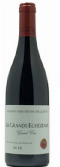
LES GRANDS-ECHEZEUX GRAND CRU 2018