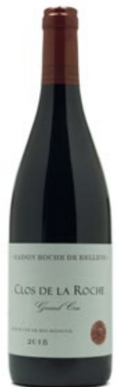
CLOS DE LA ROCHE GRAND CRU 2018