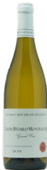
CRIOTS-BATARD-MONTRACHET GRAND CRU 2019

372,31 €/botella de 0,75l en caja de 6 botellas