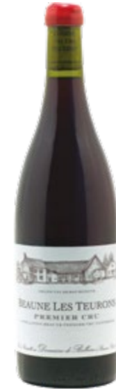
BEAUNE 1ER CRU · LES TEURONS 2018

65,15 €/botella de 0,75l en caja de 6 botellas