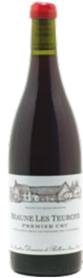
BEAUNE 1ER CRU · LES TEURONS 2018

77,59 €/botella de 0,75l en caja de 6 botellas